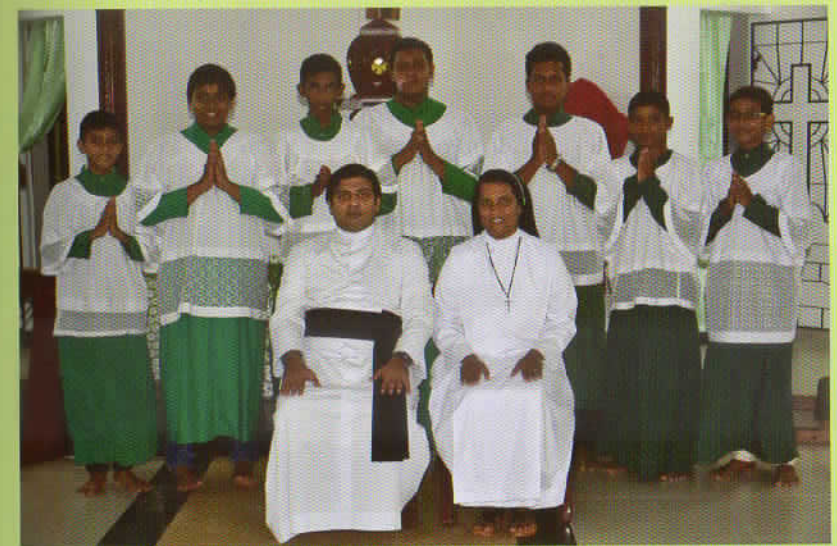
The Altar Servers