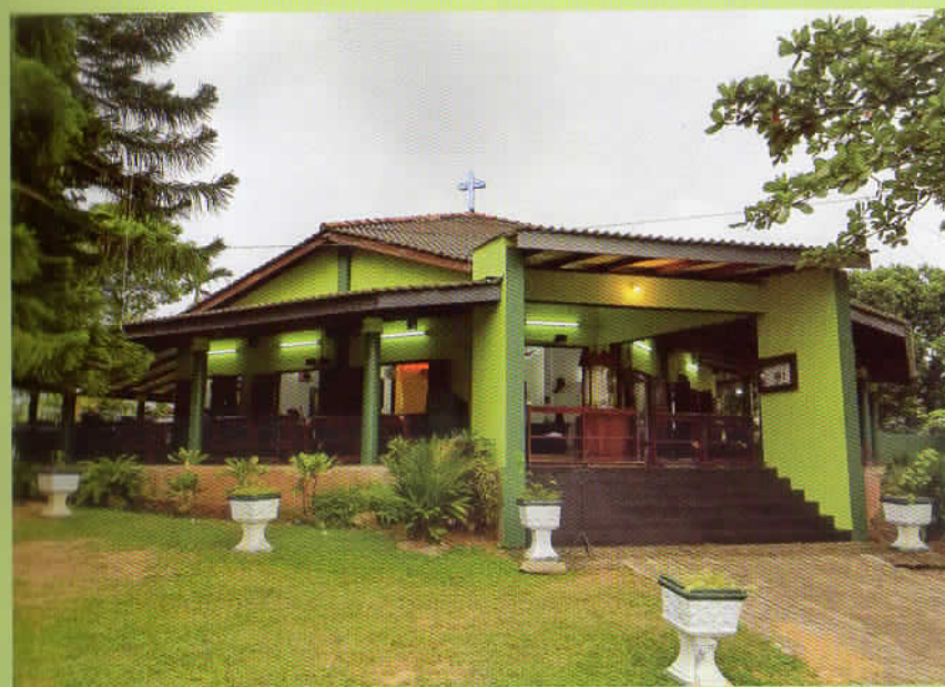
St. Jude's Church, at present