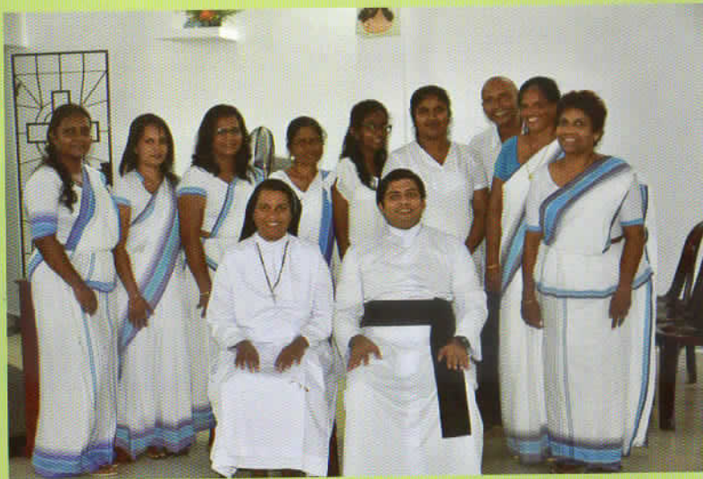
Sunday School Teachers Union