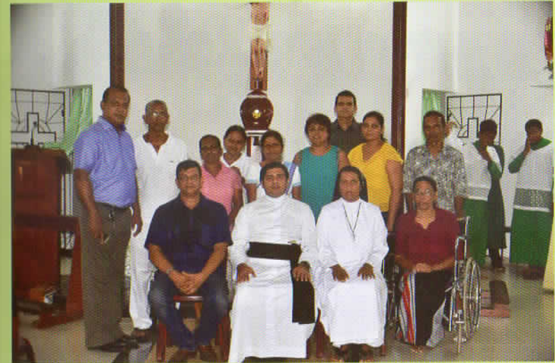
The Parish Council