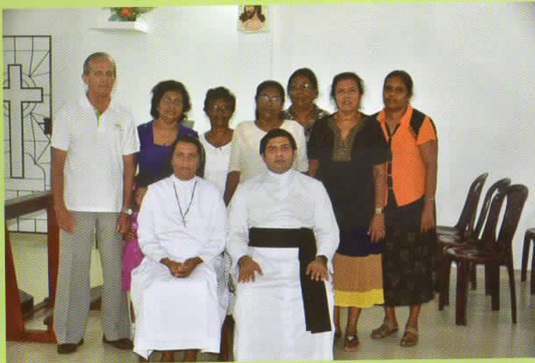
St. Vincent De Paul Society