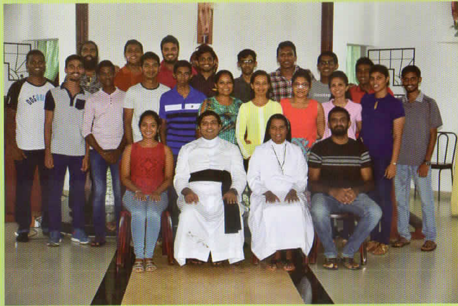
The Youth Society