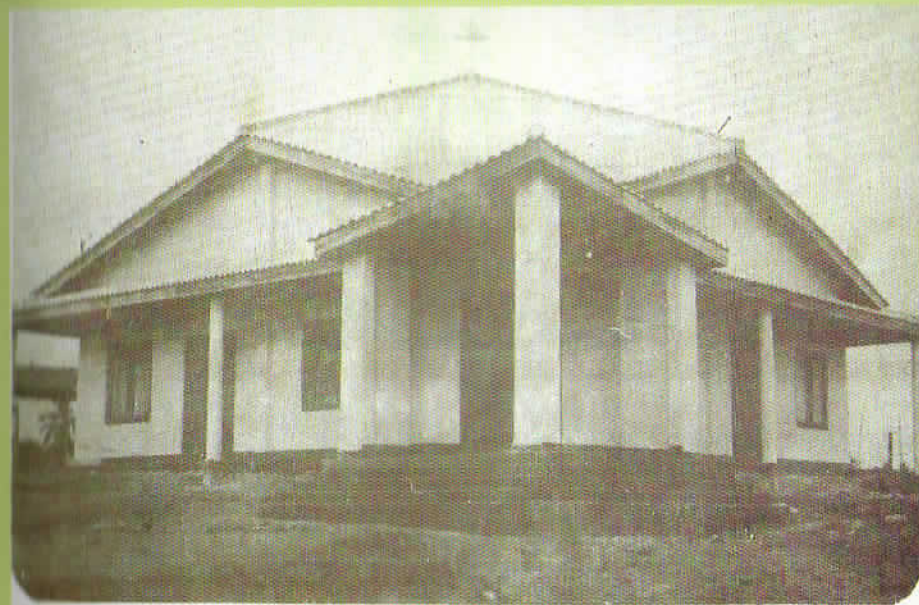
St. Jude's Church. 25 years ago